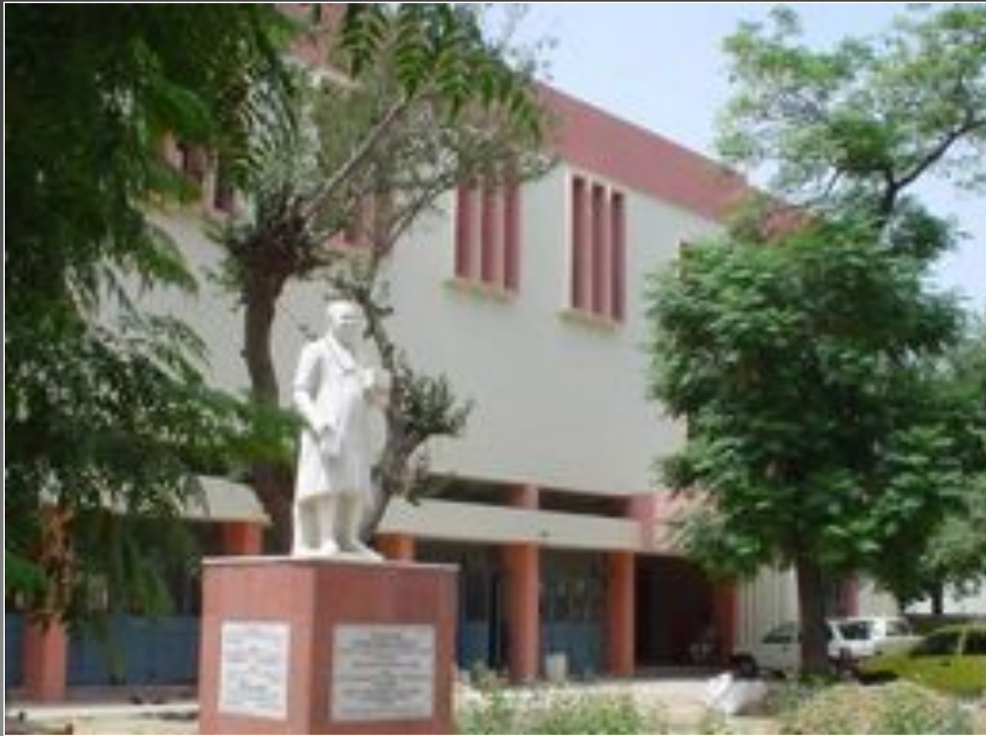
Swami Sivananda Memorial Institute (SSMI) New Delhi (1978)