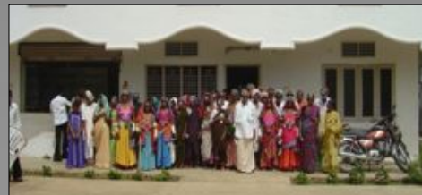
Clinique satellite de Khammam 2007