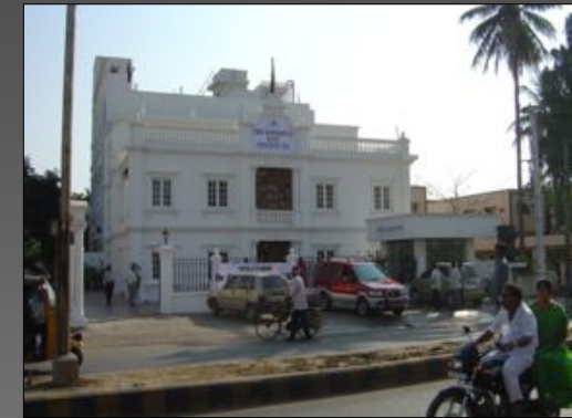
Hôpital de Bhimavaram 2005