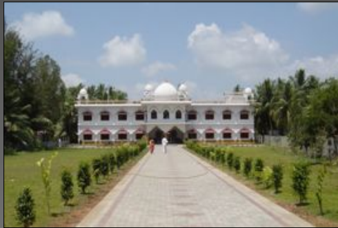
Hôpital de Mori 2002